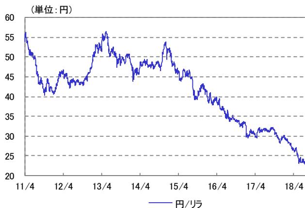
トルコ・リラ 為替レート 2011/04/01~2018/07/31