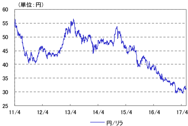
トルコ・リラ 為替レート 2011/04/01～2017/05/31