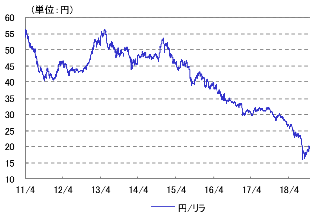
トルコ・リラ 為替レート 2011/04/01~2018/10/31