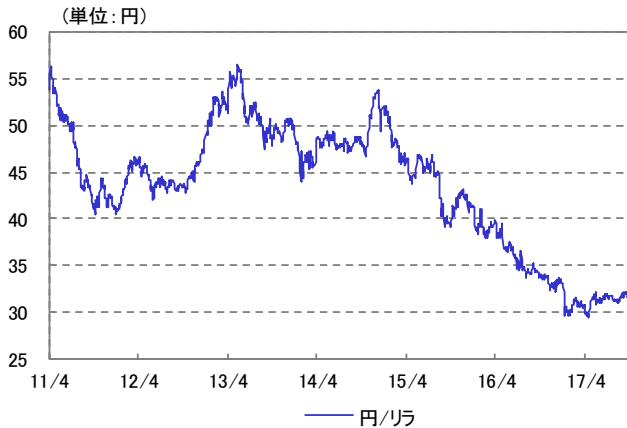
トルコ・リラ 為替レート 2011/04/01~2017/09/29