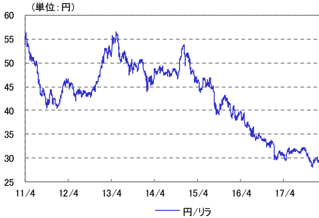
トルコ・リラ 為替レート 2011/04/01~2018/01/31